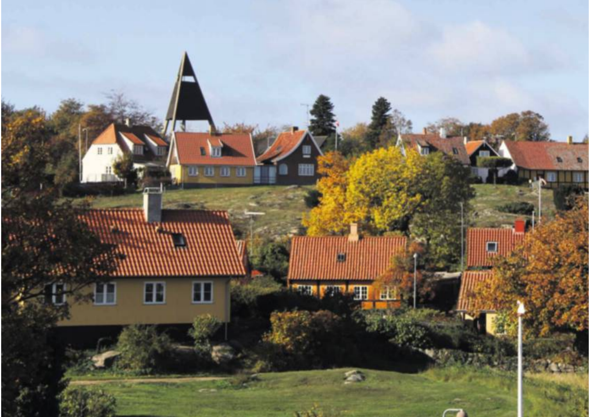
Charmerende Svaneke med de farverige huse og unikke natur.

TEKST & FOTO: EVA SOFIE ANESEN | rejseredaktionen@jp.dk